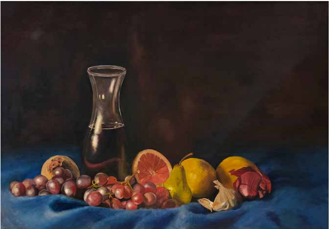
Ena Enver Knezović